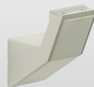
着脱手摺受金具 (横付用)