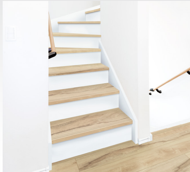
踏板は溝加工済み