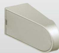
着脱エンドエルボ