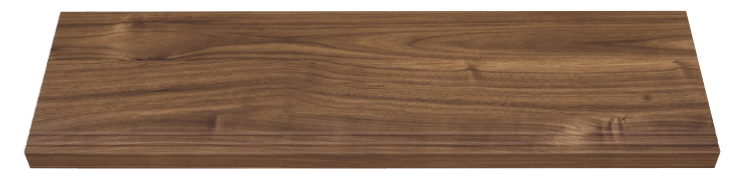
ウォールナット柄 (WT)