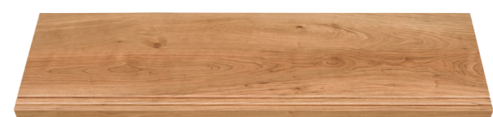
ブラックチェリー柄 (BC)